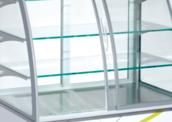
Detail of opened front sliding doors (self-service) / Detail der Öffnung der Fronttür (self-service)