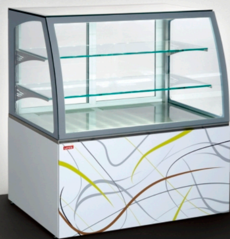
■ Virginia 1000 Low