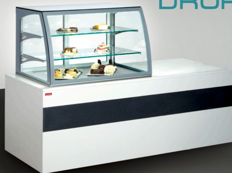
■ Virginia 1000 Low DROP-IN built-in counter

■ The showcase can be produced in DROP-IN modification which is suitable for installation into issue counter. ■ Die Glasschränke können auch in einer DROP-IN Ausführung bestellt werden, die Einbau in Ausgabetheken ermöglicht.