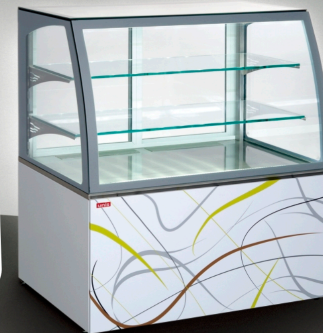
■ Virginia 1000 Low, Serve over