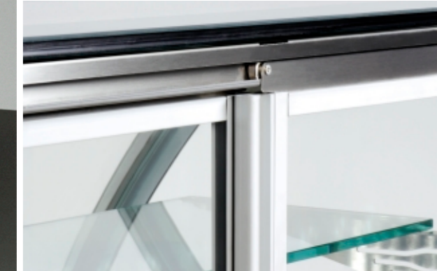
Detail of the door movement system / Tür-Verschiebung Detail