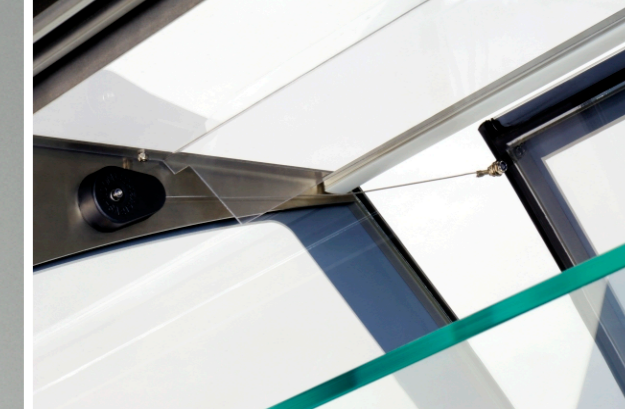
The reel for folding the front glass / Winde, um das Frontglas abzukippen