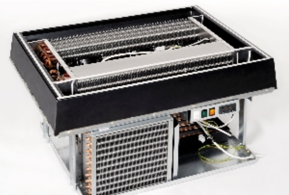
Cooling unit. Quick and easy dismantling / Kühlaggregate. Einfacher und schneller Abbau