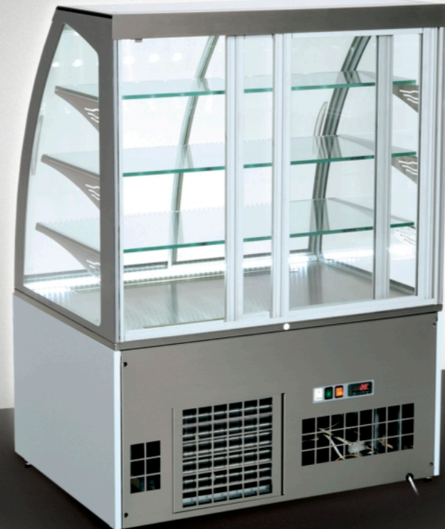
■ Rear view of showcase / Rückansicht auf den Glasschrank