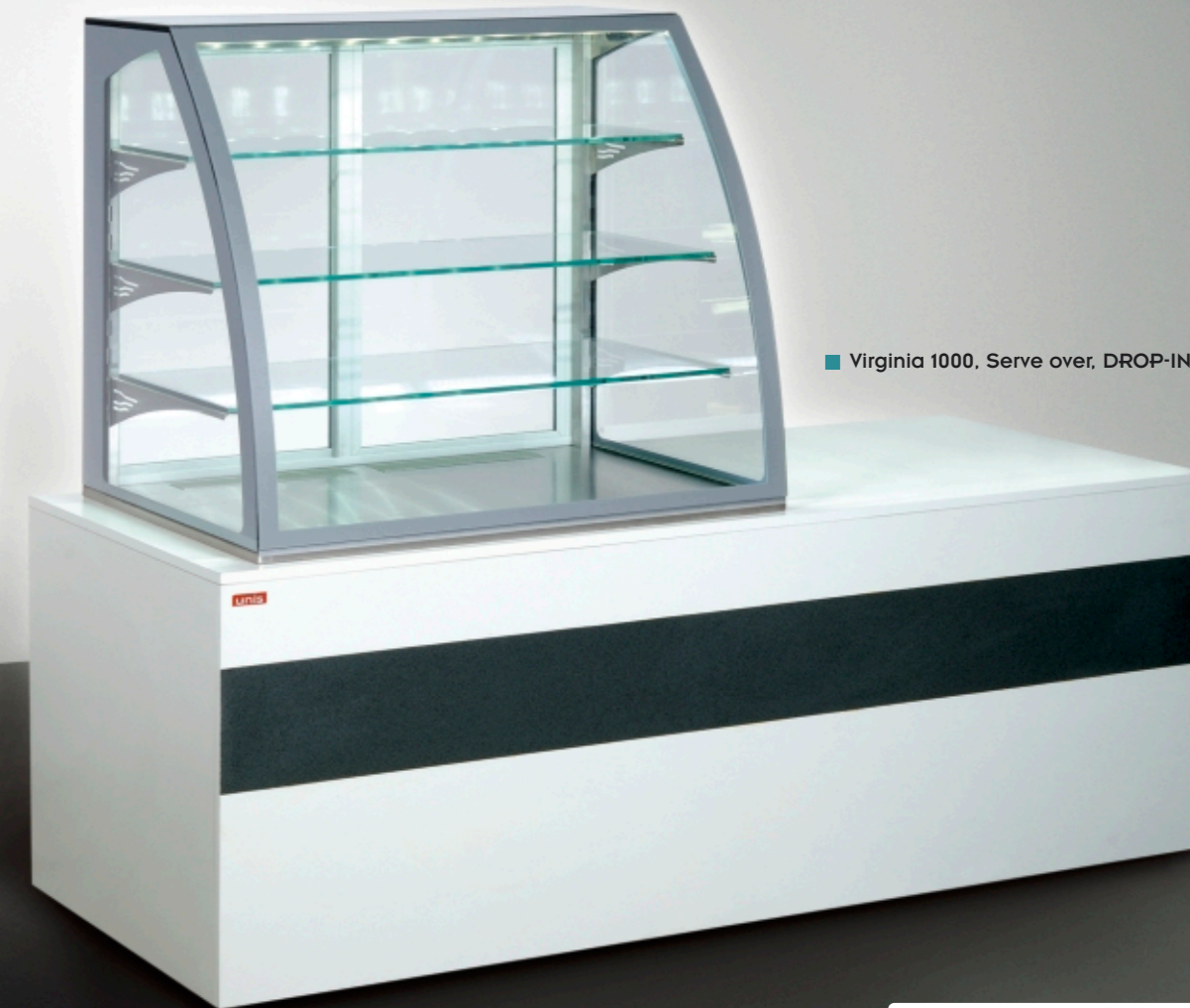
■ Virginia 1000, Serve over, DROP-IN