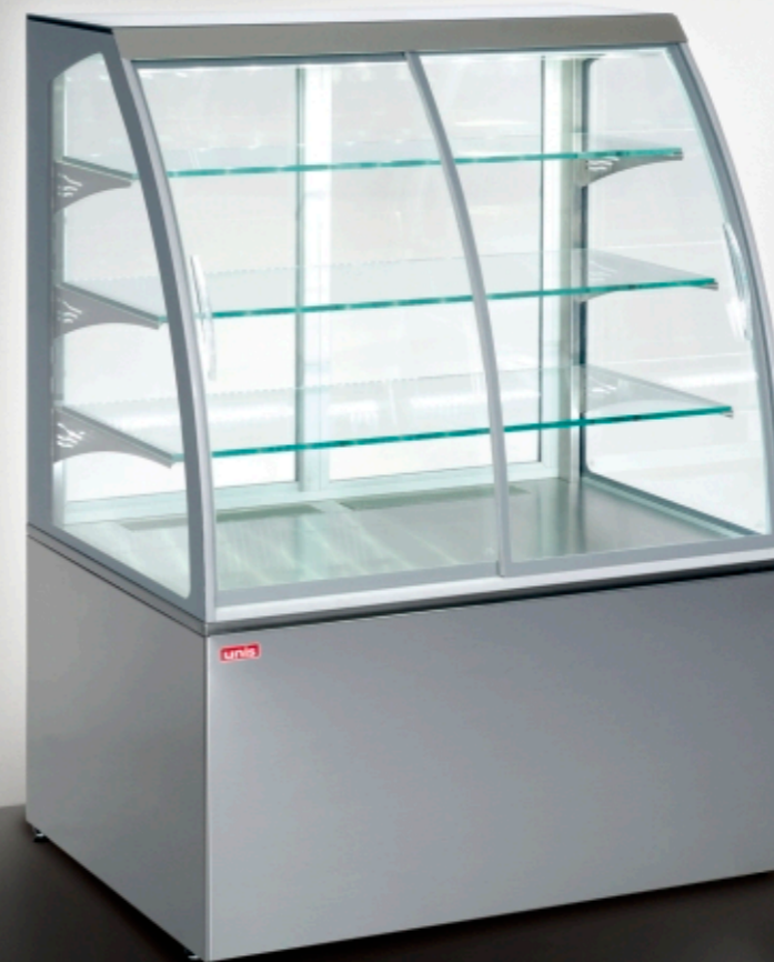
■ Virginia 1000 Self-service INOX