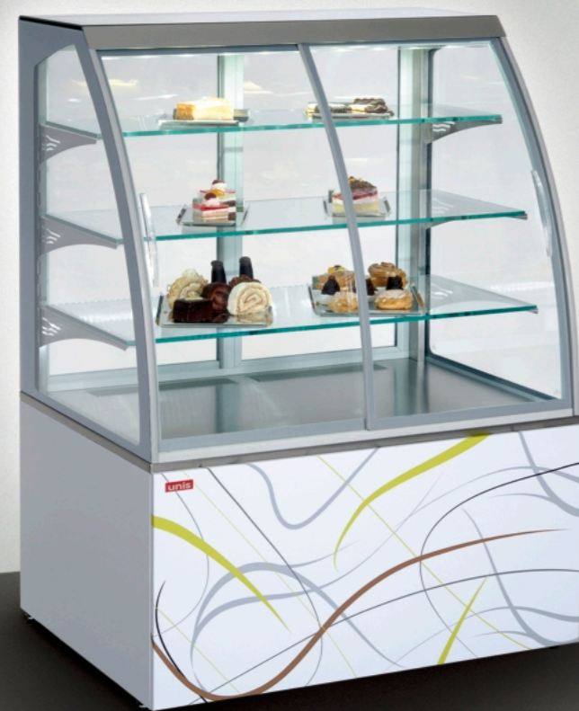
■ Virginia 1000 Self-service